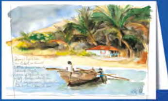
Les cartons Kim ROUCH