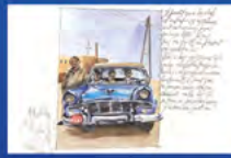
Les cartons ARIOL