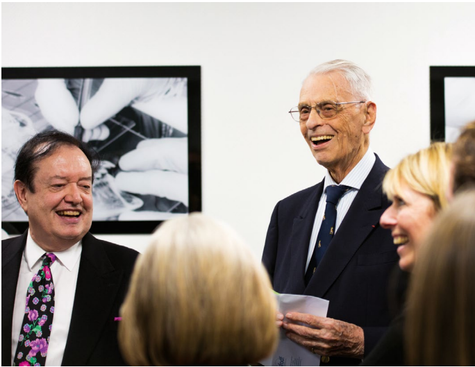
SOIRÉE D'INAUGURATION LOCAUX SFODF, PARIS 1 ER

Alors que la SFODF a fêté ses 100 années d'existence en 2021, c'est aujourd'hui un 100 e anniversaire tout aussi important que nous souhaitons célébrer.